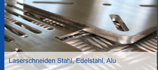
Laserschneiden Stahl, Edelstahl, Alu

Maßgeschneiderte Lösungen von Prototyp bis zur Serienfertigung